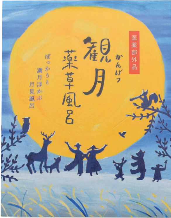
さわやかなキクの香り