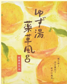
〈変更前〉ゆず湯薬草風呂

6月ご案内の「2023 ゆず&りんごカタログ」に掲載した 内容を勝手ながら変更させていただきます。